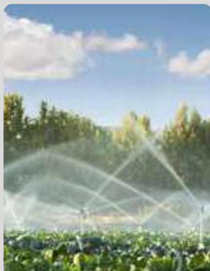
AGRICULTURA Y RIEGO