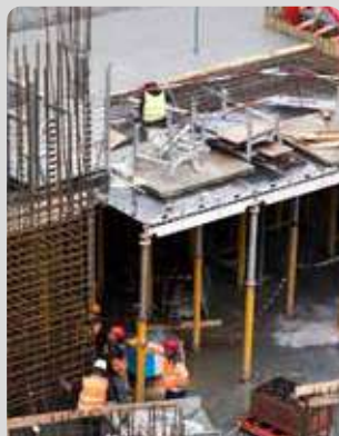
CONSTRUCCIÓN Y OBRAS