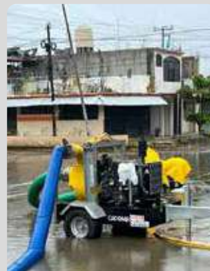
SANEAMIENTO Y MANEJO DE AGUAS